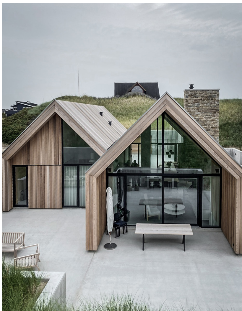
COTO 62 // TRÆ/ALU