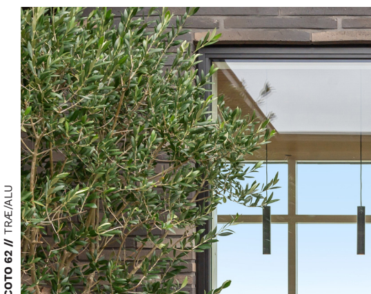
COTO 62 // TRÆ/ALU