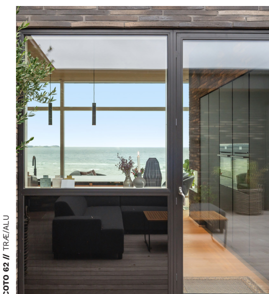
COTO 62 // TRÆ/ALU