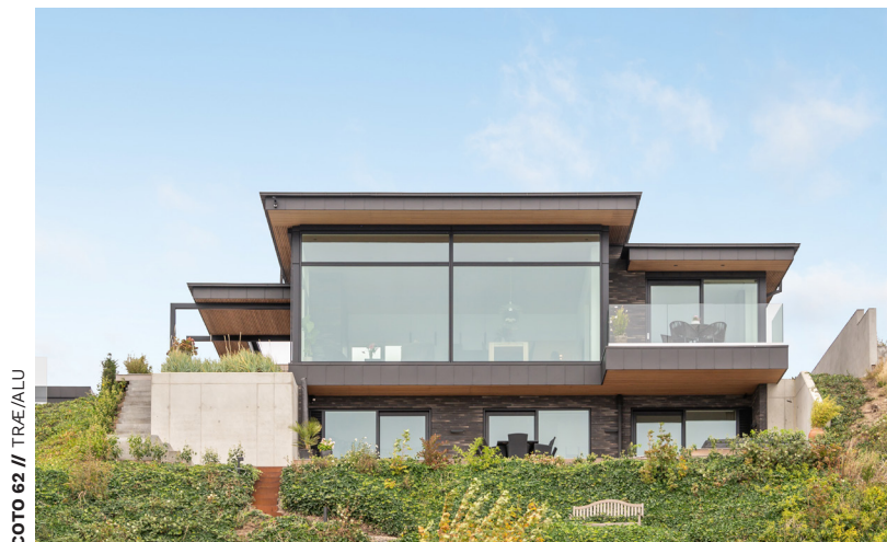
COTO 62 // TRÆ/ALU