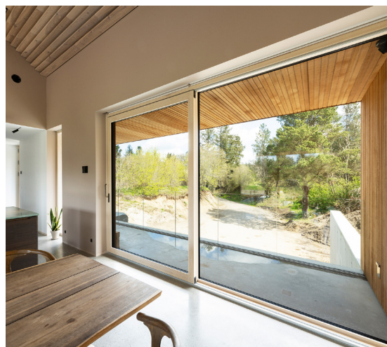
COTO 62 // TRÆ/ALU